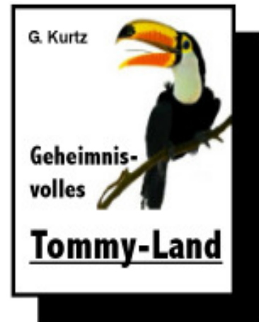
Infomappe 60 Euro