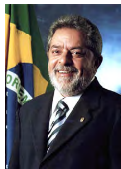
Lula Da Silva

Über die brasilianische Wirtschaft sollten Sie sich soviel merken: Die einst berüchtigten Schulden- u. Währungsprobleme gehören schon lange der Vergangenheit an. Heute gibt es einen grundsoliden "Real" und einen tollen Präsidenten, der zwar so rot ist wie Oskar Lafontaine, aber zum Segen aller tätig ist, inclusive der Staatskasse u. der Unternehmer. So hat "Lula" die IWF-Kredite vorzeitig zurückgezahlt, dabei fast eine Milli-arde Zinsen gespart und außerdem die Konjunktur so weit belebt, daß seit seiner Amtseinführung 2002/03 die Zahl der Arbeitsplätze um 4 Millionen anstieg.